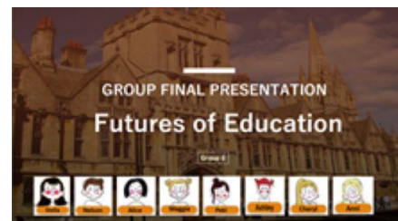
项目设计及成果展示