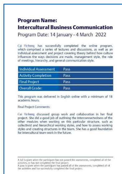
成绩评定报告（样例）