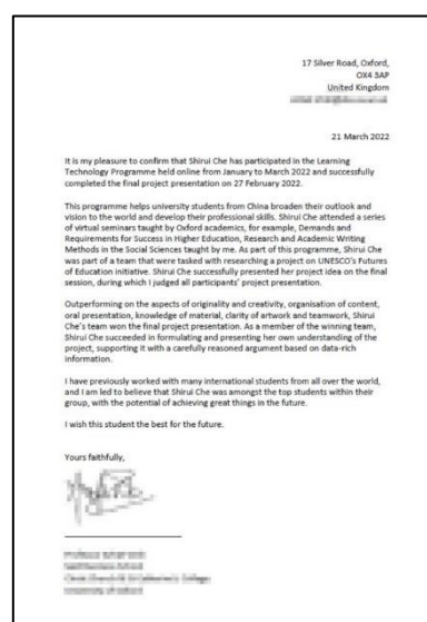
优胜小组嘉奖信（样例）